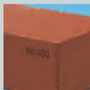
TÉGLA, KŐ, KERÁMIA